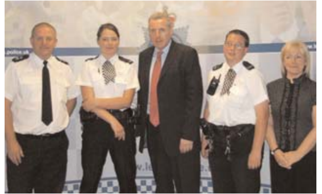
12 ganol dydd, Dydd Mercher 12 Gorffennaf, Vernon Coaker, yr Is-ysgrifennydd dros Blismona, Diogelwch a Diogelwch Cymunedol, yn cyfarfod â swyddogion timau plismona cymdogaeth New Parks a Beaumont Leys yng Nghaerlŷr i drafod eu gwaith gyda'r gymuned leol