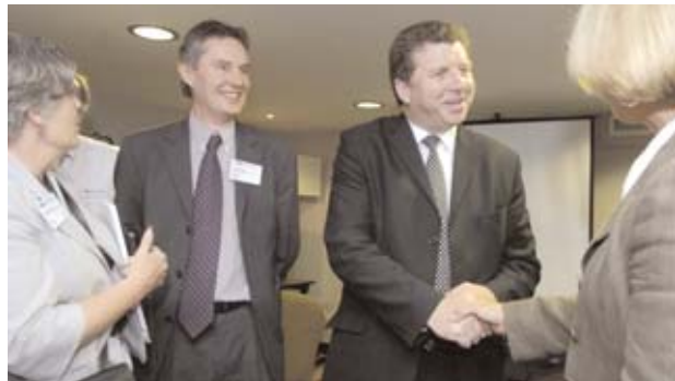
2pm, Dydd Mercher 5 Gorffennaf, Gerry Sutcliffe, yr Isysgrifennydd dros Gyfiawnder Troseddol a Rheoli Troseddwy, yn cyfarfod â staff y Gwasanaeth Rheoli Troseddwy Cenedlaethol yn Sheffield