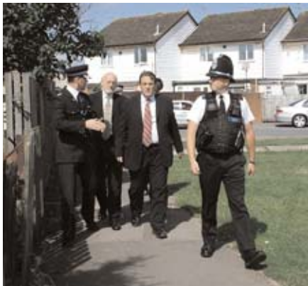
11am, Dydd Iau 13 Gorffennaf, Tony McNulty, Gweinidog dros Blismona, Diogelwch a Diogelwch Cymunedol, yn cyfarfod â swyddogion heddlu Gwent ar Ystad Llysweri, ynghyd â Nick Ainger, Is-ystrigfennydd Cymru